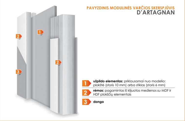
PAVYZDINIS MODULINĖS VARČIOS SKERSPJŪVIS D'ARTAGNAN